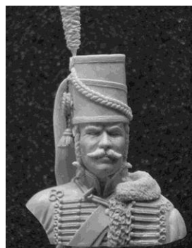
N° 19 Hussard en « mirliton » 1791