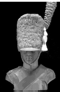
N° 13 GENDARME d'Élite à cheval