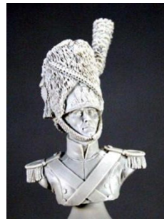
BH007 Grenadier à pied de la garde