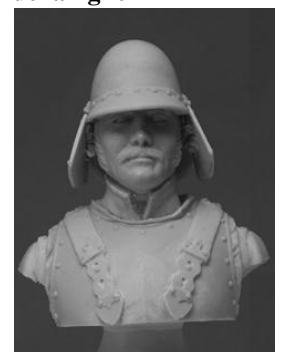
N° 21 Sapeur de la Garde