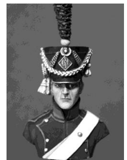
N°16 Chasseur a cheval de la ligne