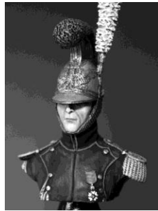
BH010 Génie de la garde