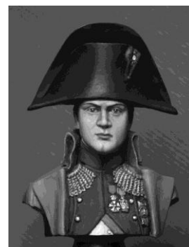
N° 20 Buste NAPOLEON 1er