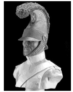
BH008 Cheval-légers LANCIER