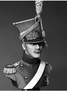
BH009 Lancier de la garde