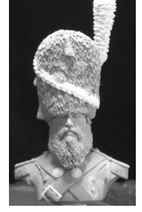
BH012 Sapeur de la garde