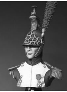
BH005 Dragon de la garde