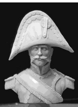
N° 17 Tambour-major des Grenadiers à pied