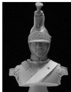
N° 14 Cuirassier