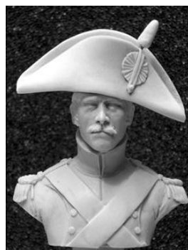
N° 18 Voltigeur Infanterie de la Ligne